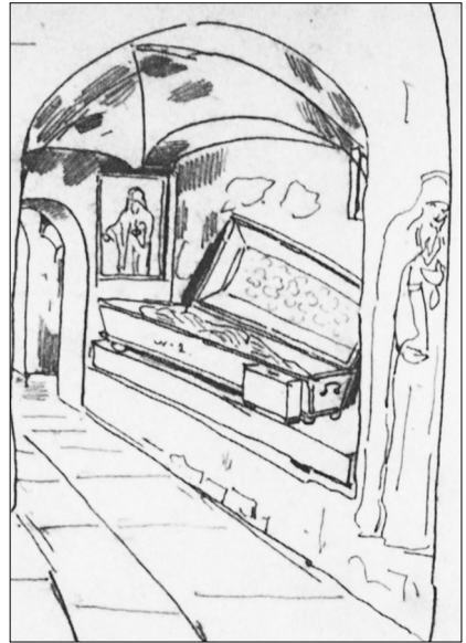
Рис. 3. Мазер К.-П. Дальні печери. Фрагмент з карнавкою біля раки св. препод. Макарія диякона [14, с. 36, іл. 20]

Окрему людину до хреста св. препод. Марка Печерника, окрім додаткового пошанування угодника, могли виділити на допомогу провідникові, щоб прискорити та раціональніше скерувати потік вірян. Адже навіть місце виконання послуху перенесли з урахуванням зручності й для запобігання тисняві.