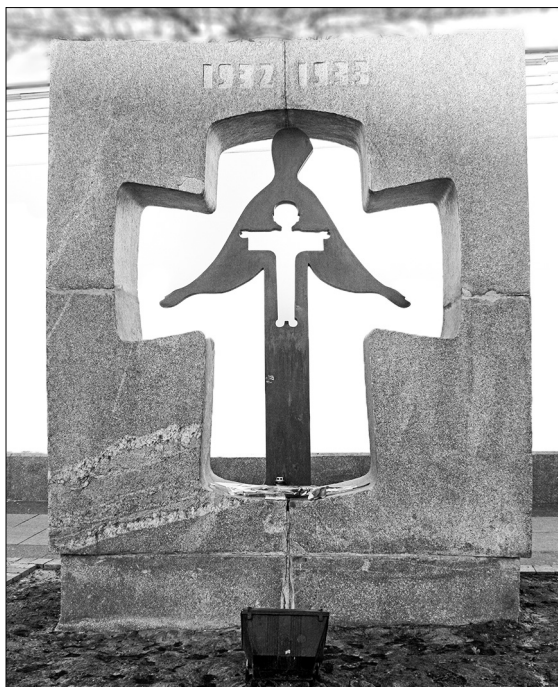
Фото 2. Автор — Кирило Денисов

мою: населений пункт, назва, дата встановлення, розміщення, координати, фото, короткі відомості. Наразі ресурс містить інформацію про 119 пам'яників жертвам Голодомору у 18 областях України. Деталізована картина така: Вінницька область — 1 (с. Андрушівка Погребищенського району); Дніпропетровська область — 3 (Жовті Води, Кривий Ріг, П'ятихатки); Донецька область — 1 (Маріуполь); Житомирська область — 23 (Великі Гадомці Бердичівського району, Городське Коростишівського