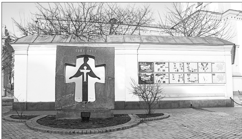
Фото 1.

пам'ять тривалий час зберігалася лише в діаспорі. Саме там з'явилися на відзнаку 50-х роковин трагедії перші пам'ятники й монументи. В Україні ж спорудження пам'ятників, знаків, хрестів у пам'ять про загиблих під час Голодомору почалося лише наприкінці 1980-х рр. Тоді в самому Києві було встановлено меморіальний знак на Михайлівській площі (Фото 1, 2). Пам'ятник-меморіал жертвам голоду також було споруджено біля Мгарського Спасо-Преображенського монастиря, що на Лубенщині, в інших місцях.